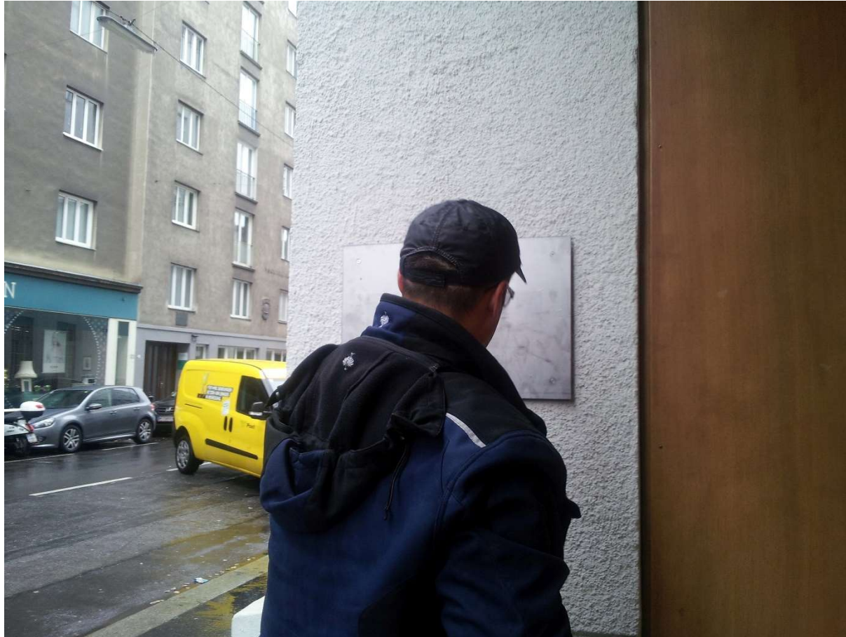
Die Unterlage wird montiert