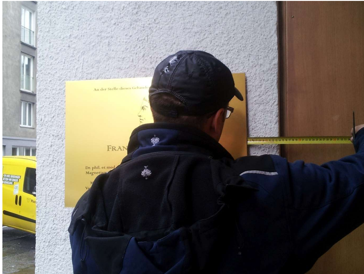
Genaueres Positionieren der Tafel