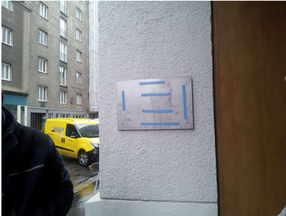
Vorbereitung zum Kleben der Tafel