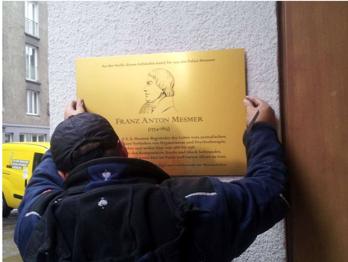
Die Tafel wird auf die Unterlage aufgebracht