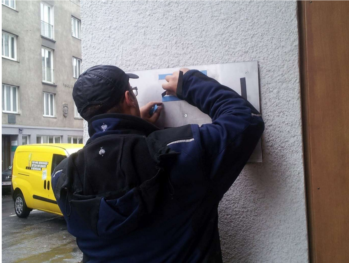
Vorbereitung zum Kleben der Tafel